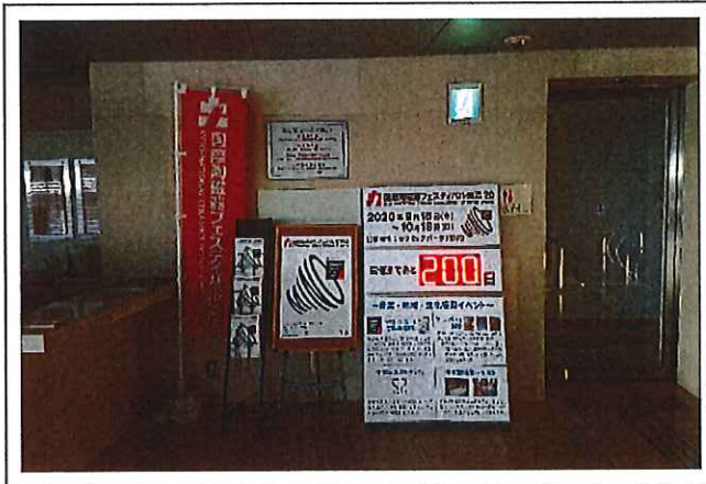
【セラミックパーク MINO】